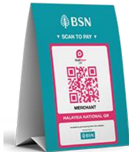
'Standee' DuitNow QR