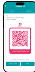
Kod DuitNow QR dijana daripada peranti mudah alih peniaga