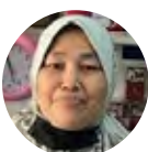
EB BSN Semat Trading, Pulau Pinang

Selamat menyambut Hari Kemerdekaan dan Hari Malaysia. Semoga Malaysia terus maju dan makmur, rakyat dapat hidup dengan aman tanpa mengira bangsa agama dan parti politik