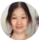
EB LN Collection, Sarawak

Selamat Hari Kemerdekaan dan Selamat Hari Malaysia buat rakyat Malaysia!