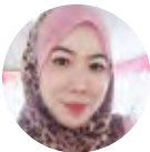
EB Indah Bunian Enterprise, Melaka

Selamat Hari Merdeka! Semoga Negara kita terus makmur dan maju ke hadapan.