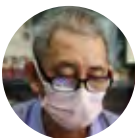
EB Jin Han Trading, Sarawak

Saya mengucapkan Selamat Hari Kebangsaan buat seluruh rakyat Malaysia. Dan mendoakan agar Malaysia akan terus aman dan makmur.