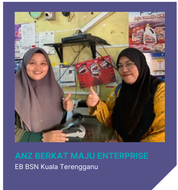
ANZ BERKAT MAJU ENTERPRISE EB BSN Kuala Terengganu

Secara kesimpulannya, kepelbagaian bangsa di Malaysia adalah sumber kekayaan yang besar bagi negara ini. Musim perayaan menjadi wadah yang sempurna untuk meraikan kepelbagaian ini dengan penuh keharmonian dan kegembiraan. Semangat saling hormat-menghormati, memahami, dan menghargai antara satu sama lain menjadikan Malaysia sebagai contoh dalam memupuk keharmonian dalam kalangan masyarakat yang berbilang bangsa dan agama.